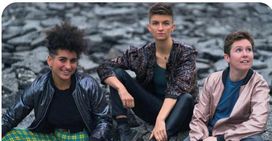
Le groupe Diluvienne : Trio de chant polyphonique.