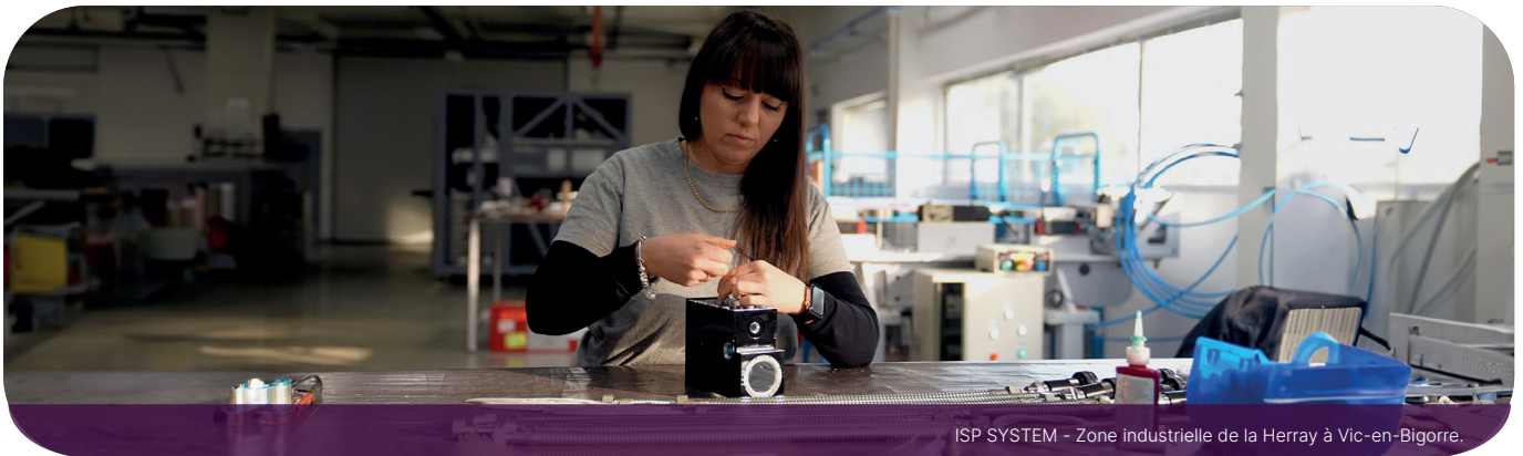
ISP SYSTEM - Zone industrielle de la Herry à Vic-en-Bigorre.