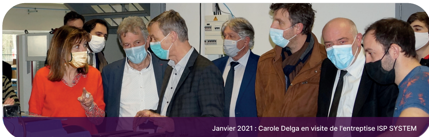
Janvier 2021 : Carole Delga en visite de l'entreprise ISP SYSTEM

ISP System s'est engagée notamment dans le développement d'équipements mécatroniques pour l'aéronautique à bas carbone avec le soutien de France 2030. Ce projet et d'autres pourraient conduire à une très forte croissance d'ISP System et du groupe ISP sur Vic-en-Bigorre. Le soutien qui nous est apporté par le dispositif « Territoire d'Industrie Lacq-Pau-Tarbes » contribuera à accompagner ISP System dans cette phase de croissance.