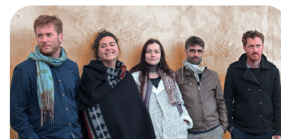
Le groupe LAÛSA : tradition musicale gasconne

15h : Accueil du Public et présentation de la saison 2024 du pôle culture