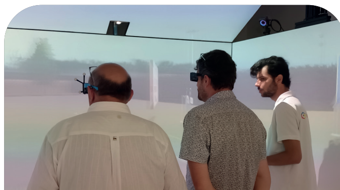
Visite de l'entreprise VirtualConcept et première expérience immersive pour les élus de la CCAM.

Le cube immersif sera placé à l'Abbaye de Saint-Sever de Rustan, qui possède une salle parfaitement adaptée. Il constituera un outil de développement parfait pour le projet porté par le groupe SOS en l'Abbaye : tiers-lieu artisanal, lieu de séminaire, médiation culturelle.