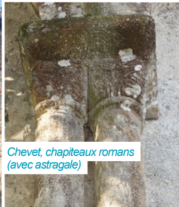
Chevet, chapiteaux romans (avec astragale)