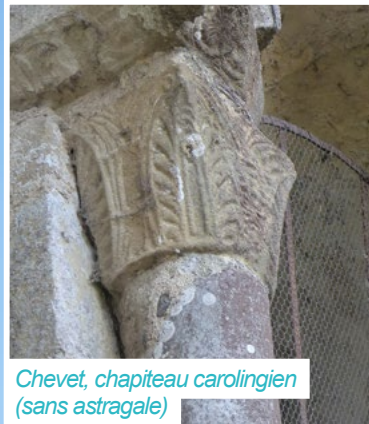
Chevet, chapiteau carolingien (sans astragale)