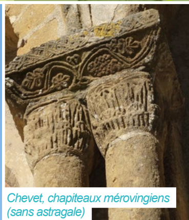
Chevet, chapiteaux mérovingiens (sans astragale)